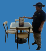
Habilitar mesas, sillas y sillones