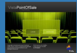
Abrir turno en sistema