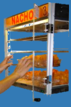
Habilitar Exhibidor de nachos