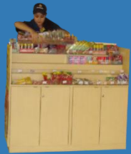
Sacar dulces empaquetados