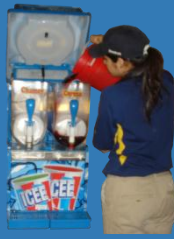
Habilitar Máquina slush