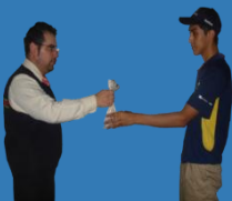
Recibir fondo y llaves