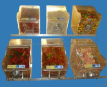
Habilitar Bins de dulces a granel