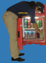
Habilitar Refrigerador de bebidas embotelladas