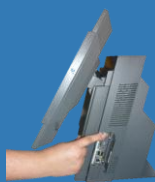
Habilitar punto de venta