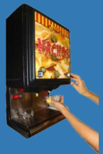
Habilitar Dispensador de queso