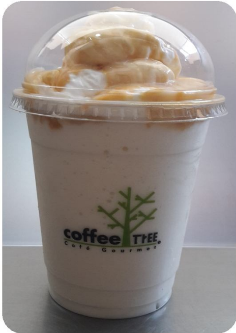
Frappé La Lechera

Su consistencia será más líquida por la cantidad de lechera que se le coloca