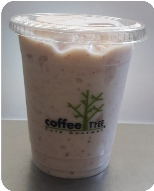
Frappé Yogurt Arándanos

Frappé Yogurt Arándanos es el único frappé que por receta no llevan crema batida ni decoración en su presentación.