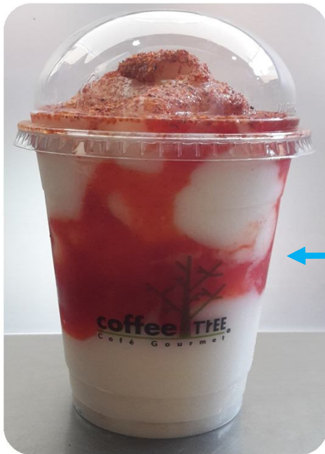
Chamoyada de Guanábana

Todos nuestros Smoothies se pueden hacer Chamoyada.