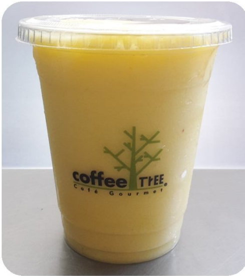
Smoothie de Piña Colada

Su consistencia será más líquida que el resto de los smoothies por el tipo de concentrado