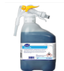
Virex II 256