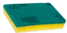
Fibra verde P-94

Toma en cuenta que tanto los utensilios como los químicos nunca deben de estar a la vista de los clientes mientras no se estén usando.