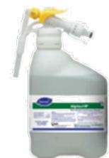
Alpha - HP