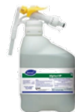
Alpha - HP