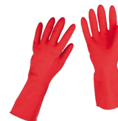
Guantes de plástico