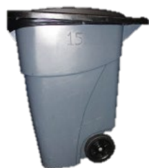
Bote Big Wheel