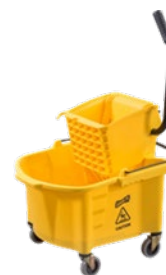
Cubeta con escurridor