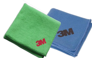
Paños Verde & Azul