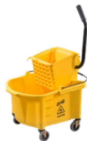
Cubeta con escurridor