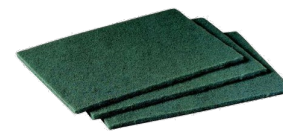
Fibra verde P-96