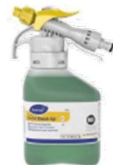
Suma Break Up