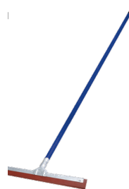
Jalador de agua