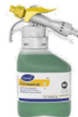
Suma Break Up