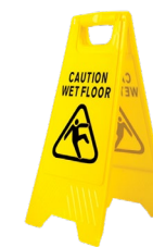
Señalamiento piso mojado