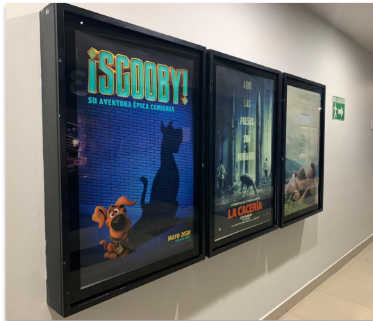
Cajas de luz

En caso de que tu conjunto cuente con alguna de estas áreas deberás realizar lo siguiente: