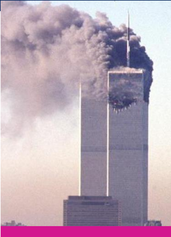
Ataques a las torres gemelas