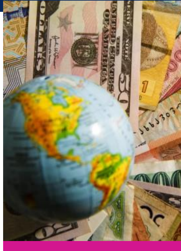
Crisis económica de 2008