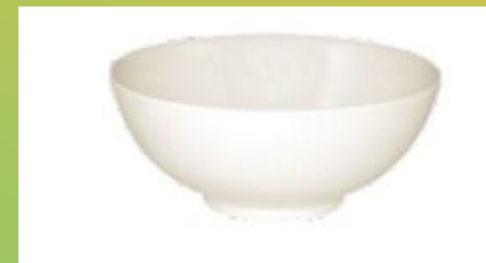
TAZA DE 16 OZ