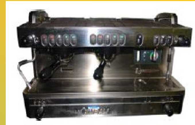
Semi Automática Cimbali

Esta cafetera no tiene ciclo de lavado automático.