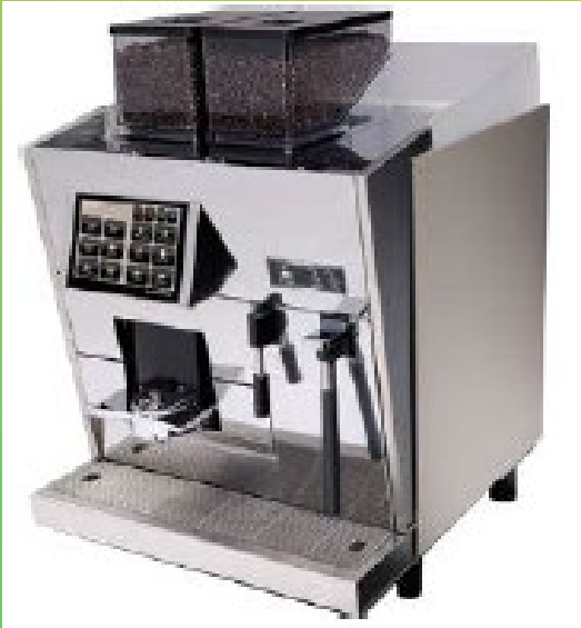
Black & White

⚠ Ubica el tipo de cafetera con la que cuentas en tu conjunto o negocio