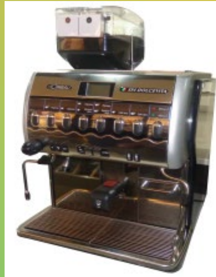
Super Automática Cimbali