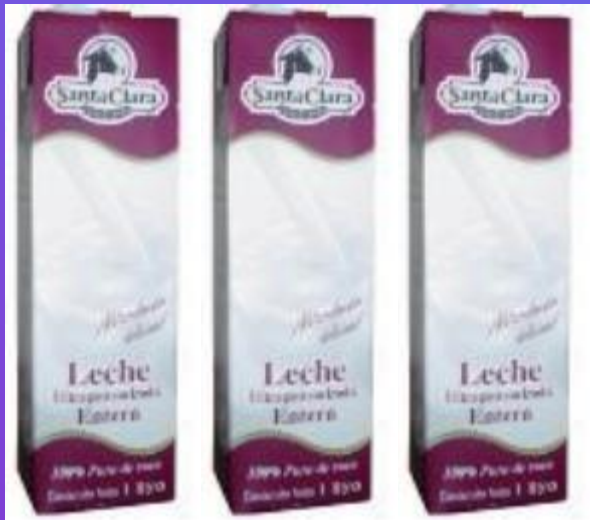
3 litros de leche entera