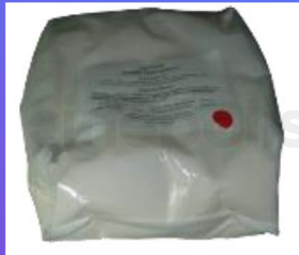
Harina para crepas 1.5 kg