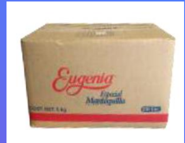
Mantequilla 70 gr.