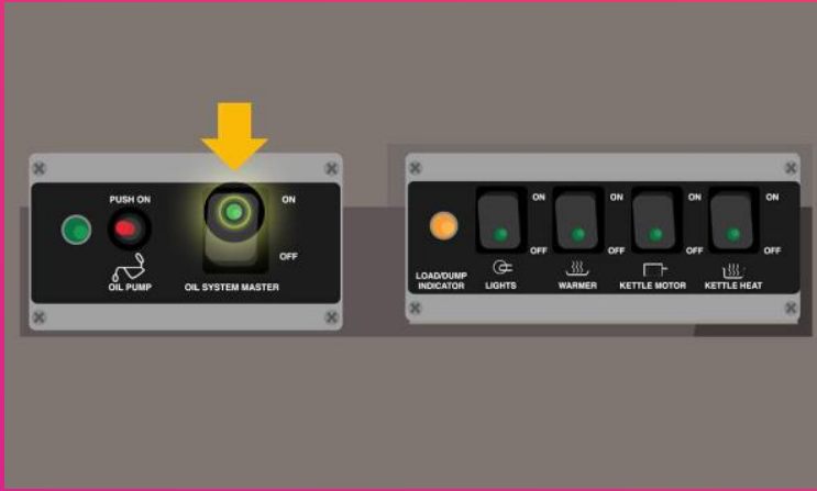
ON OIL SYSTEM MASTER Sistema de aceite