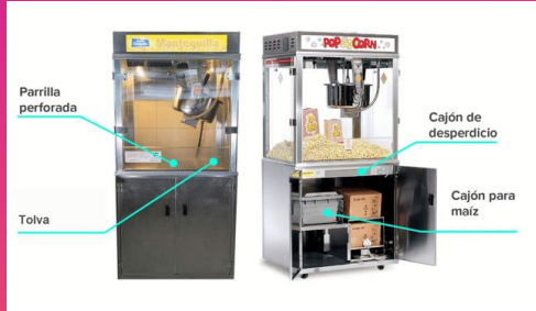
Montaje de Palomera: colocar tolva, parrilla y cajón de desperdicio