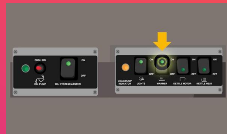
ON WARMER Calentador