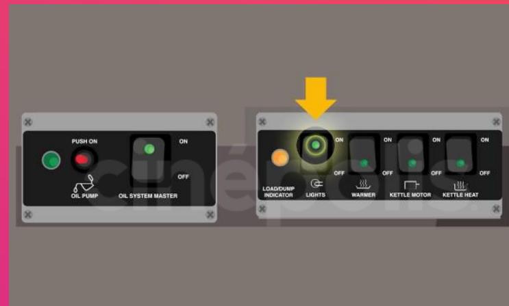
ON LIGHTS Luces de la palomera