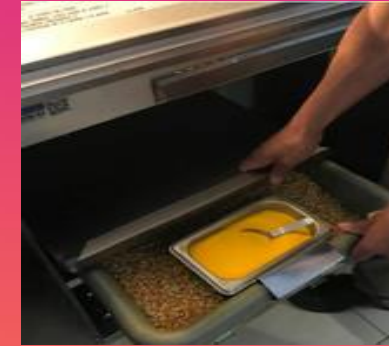
Contenedor de saborizante: colocarlo al borde del cajón de maíz (por dentro)