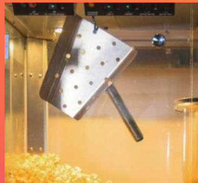
Cucharón: Colocar dentro de la palomera (colgado o imantado)