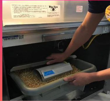
Medidor Maíz: colocarlo dentro del cajón del maíz