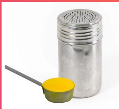
Salero: Colocar cerca de la palomera. (Cheddar, Takis y Doritos)