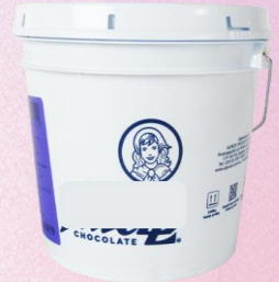
Mermeladas y Cobertura chocolate