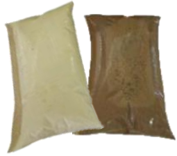
Base láctea de vainilla y chocolate