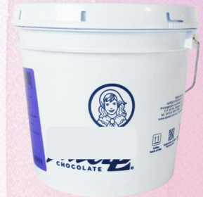
Mermeladas y Cobertura chocolate