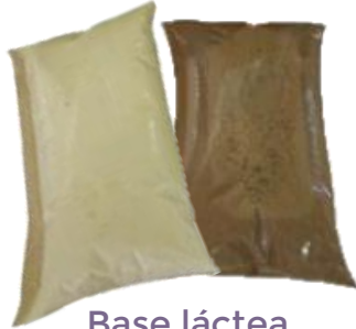
Base láctea de vainilla y chocolate