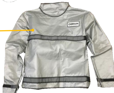
2 Chamarra especial